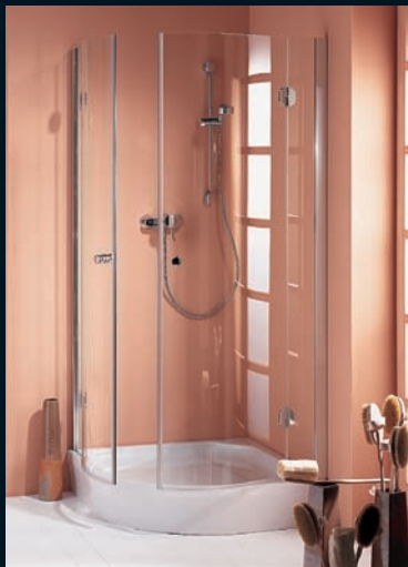
BO 3401 TYPE 260

functional glass-to-glass connectors maximise the transparency desired in frameless glass showers. With this system, one hardware combination fits all six shower types.