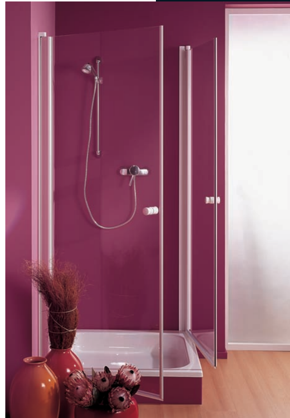
PH 531 TYPE 120

A classic in the GRAL shower system range! The PH 531 system is characterised by its continuous pivoting wall profile. The door is raised on opening and it closes automatically from an angle of approx. 30°. Since clamping profiles are used, no glass drilling is required.